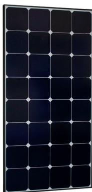
Sun Peak SPR 110 Sun Peak SPR 110_46