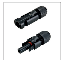
Standard4 connectors / Standard4 Verbinder

Find technical data on the next page. Technische Daten auf der nächsten Seite.